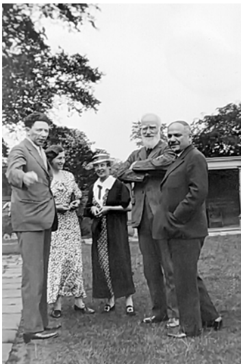
Bernard Shaw és rebut a l'ambaixada. Amb Lloyd George, el "Vell Mag".