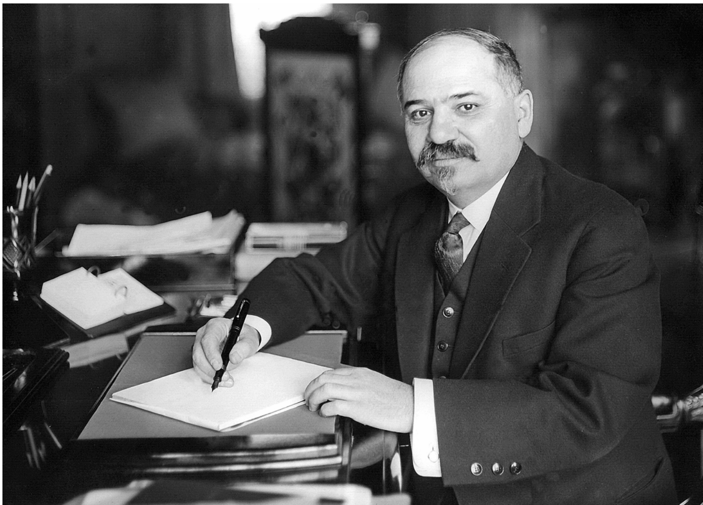
Maiski en estat pur, amb ploma i paper.